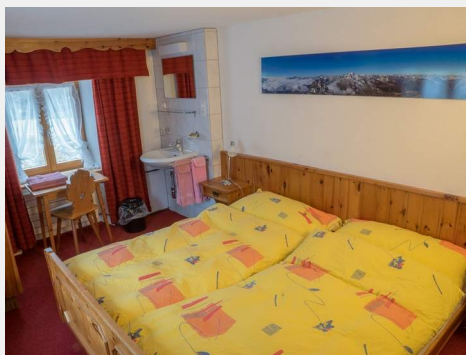
Zimmer 12 Doppelzimmer mit Etagedusche/WC, getrennte Matratzen