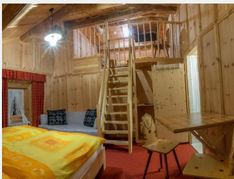
Zimmer 23 Mehrbettzimmer über 2 Etagen, mit Dusche/WC, getrennte Matratzen

1 Einzel- und 2 Doppelzimmer mit fließend warm und kalt Wasser