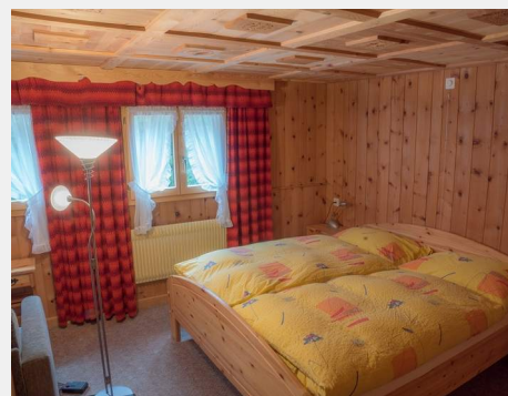
Zimmer 24 Doppelzimmer mit Dusche/WC, getrennte Matratzen