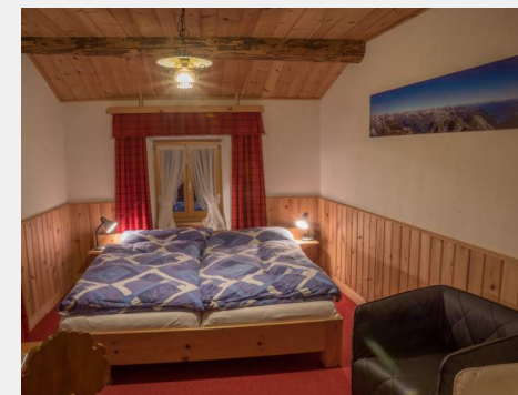
Zimmer 22 Doppelzimmer mit Dusche/WC, getrennte Matratzen