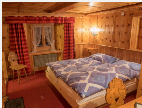
Zimmer 25 Doppelzimmer mit Dusche/WC, getrennte Matratzen