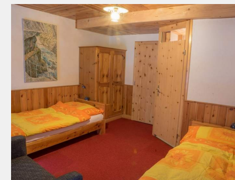
Zimmer 21 Einzelzimmer mit Dusche im Zimmer und WC auf der Etage