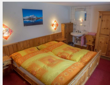
Zimmer 13 Doppelzimmer mit Etagedusche/WC, getrennte Matratzen