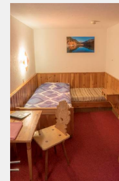
Zimmer 14 Einzelzimmer mit Etagedusche/WC