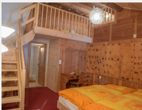
Zimmer 26 Mehrbettzimmer über 2 Etagen, mit Dusche/WC, getrennte Matratzen